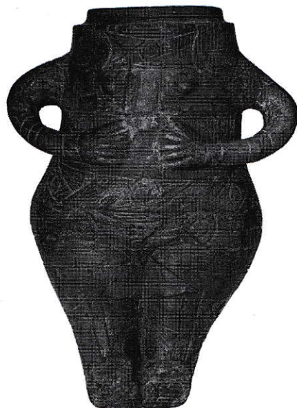
Zeița de la Vidra, Gumelnița, cca 4200-3900 î.e.n.

În a doua jumătate a mileniului al patrulea înaintea erei noastre, odată cu venirea indo-europenilor, se produce o ciocnire puternică între două sisteme de credință diferite. Pe de o parte aveam societatea europeană așa cum o știam până acum, matriliniară, matricentrică și endogamă, destul de echilibrată; de cealaltă parte se află societatea indo-europeană mare iubitoare de război (și ierarhia socială, dar și cea religioasă puneau mare preț pe imaginea luptătorului infailibil), exogamă, patriarhală, patriliiniară și patrilocală. Și trebuie reținută observația Marijei Gimbutas: nu vorbim de o evoluție, ci de coliziunea a două ideologii diferite 15 .