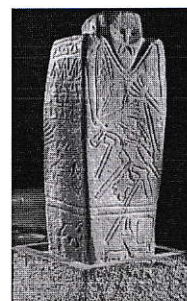
Bărbat cu atribute ale puterii (posibil zeu al furtunii), cultura Yamna: stânga, stela de la Natalivka (cca 2700-2500 î.e.n.); dreapta, stela de la Kernosovka (cca 3000-2500 î.e.n.).

Cel mai adesea natura zeului suprem era una militară, total potrivită cu nevoia imperioasă de apărare a propriului teritoriu, a neamului, dar și de cucerire, pe care o aveau toți indoeuropenii și urmașii lor mai apoi. Nu este întâmplător deci faptul că frecvent zeul suprem a fost asimilat mai apoi cu Marte al romanilor, cunoscut de către istorici și geografi, un zeu puternic și crud. Vorbind despre sciți, în Chorographia sa din 43 d.H., Pomponius Mela spunea: „Zeul tuturor sciților este Marte; îi consacră drept simbol săbii și cingătoare și ca victime îi jertfesc oameni” 17 . La sfârșitul secolului al IV-lea d.H., Flavius Vegetius vorbea și despre daci și traci în aceiași termeni, mai mult, patria lor fiind locul de baștină a zeului-simbol: „Dacii, moesii, tracii n-au fost în toate vremurile așa de războinici, că istoria legendară a făcut să se afirme că însuși zeul războiului, Marte, s-a născut în țara lor?” 18 De asemenea, pentru toate popoarele indoeuropene remarcăm venerarea, în forme diferite, a focului (nu numai cel celest, dar și cel terestru), a apei, aerului, cel mai frecvent tot la nivelul religiei populare, nu la al celei oficiale.