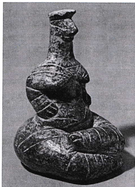
Zeița-Șarpe, perioada minoică, cca 2000 î.e.n.